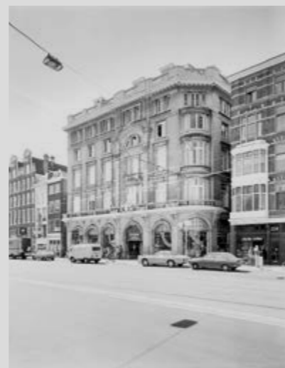
Kalverstraat/Olieslagerssteeg/Rokin, Amsterdam: Maison de Bonneterie (1909)